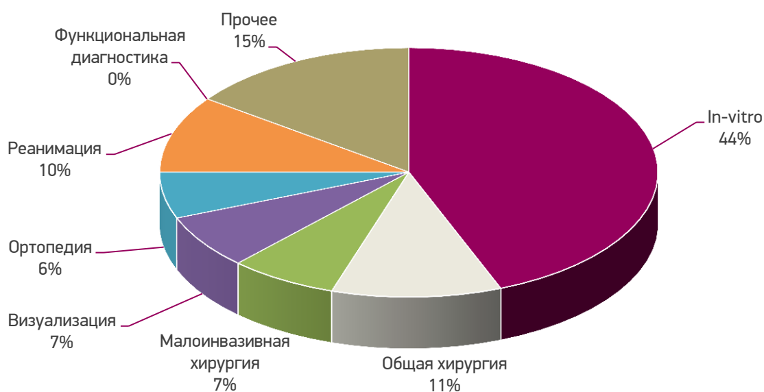
Рисунок 2. Долевое соотношение (%), руб.) в структуре государственных закупок медицинских изделий, сентябрь 2016 г.

Наибольшую долю в структуре госзакупок в сентябре 2016 года занимали такие сегменты, как МИ для in-vitro диагностики (44%), МИ для общей хирургии (11%) и МИ для реанимации (10%).